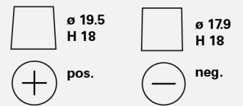
Tipos de terminales