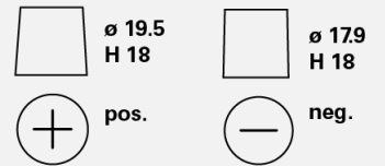
Tipos de terminales