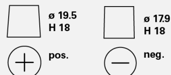
Types de bornes