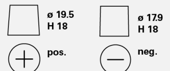
Tipi di terminali